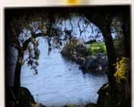
Paraje de Casillas