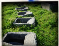
Pozo de Lavar

1. Pozo del Campillo. • 2. Puente del Capellán. • 3. Paraje de Casillas. • 4. El Pocito. • 5. Pozo de la Pizarrilla. • 6. Pozo y Charca de la Alberca de la Hoya. • 7. Embalse del Prado (El Pantano). • 8. Pozo del Sapillo. • 9. Puente de la Magdalena. • 10. Pozo de Moralejos. • 11. Encina la Solana (Árbol Singular de Extremadura en 2005). • 12. Pozo del Juncoso. • 13. Pozo de la Torbiscosa. • 14. Puente La Toma. • 15. Pozo de los Charcos. • 16. Puente Romano del Río Salor. • 17. Puente del Molino de la Rubia. • 18. Pozo de Lavar. •