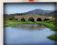
Puente Romano sobre el Río Salor