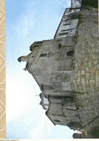
Convento de San Agustín