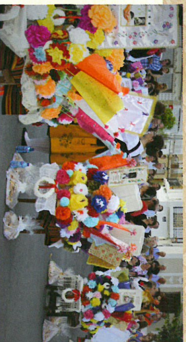
Fiesta de Los Tableros 2016

de ese año; previamente cada Madrina ha elegido a su Tablera y a dos Danzadores, continuando la representación de Los Tableros el primer Sábado de Octubre con la procesión de la imagen de la Virgen del Rosario acompañada por las Madrinan, Tableras y Danzadores, quienes van bailando la danza del "Chicurrichi" y tocando las castañuelas al compás de la música de un tambor y una flauta, desde la Iglesia de la Virgen de Bienvenida hasta la Plaza de España, donde se celebra una Misa solemne; para continuar con la subasta de Los Tableros y el Ofertorio Popular, finalizando con el baile de la Jota popular "El Verdigaio".