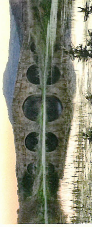
Puente Romano sobre el rio Salor