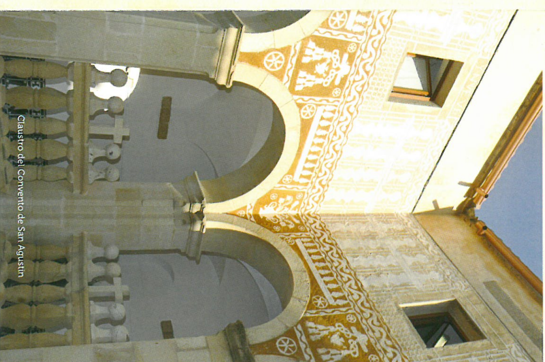
Claustro del Convento de San Agustín