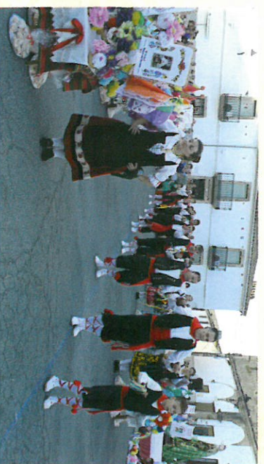
Fiesta de Los Tableros 2016