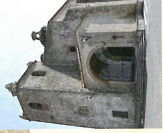
Iglesia Ntra. Sra. de Bienvenida

Es también un pueblo dinámico y activo, donde las Asociaciones y las Escuelas Municipales desarrollan un papel muy importante;