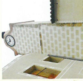
Plaza del Reloj