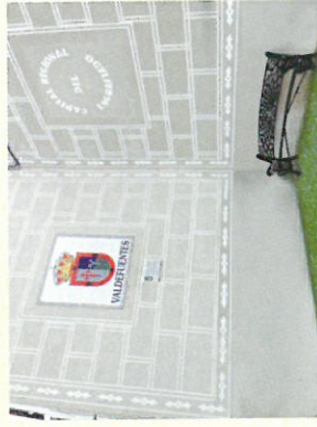
Esgrafiados en la Plaza de España

Los Esgrafiados , es una técnica de decoración de fachadas de influencia morisca muy extendida por toda la localidad, que recientemente ha sido reconocida por el Gobierno de Extremadura (28/05/2013) como “Capital Regional del Esgrafiado” .